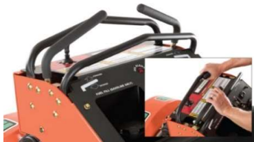
Système Quad Control Handle