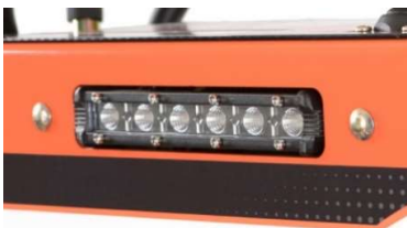
Eclairage de travail LED à l'avant