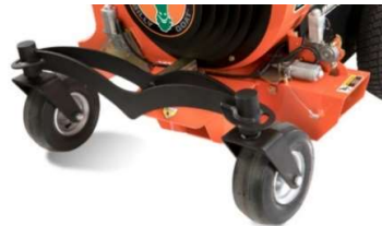
Essieu avant tordu pour une conduite confortable sur des obstacles