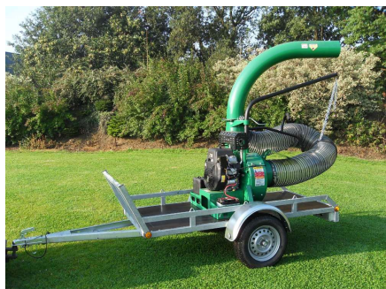
Remorque plateau de charge