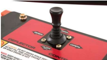
Commande du déflecteur par joystick