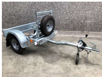
Remorque sur mesure